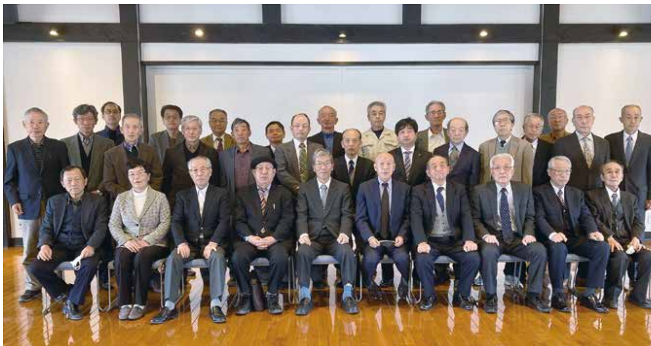
令和4年4月1日南砺市土地改良区組織役員会